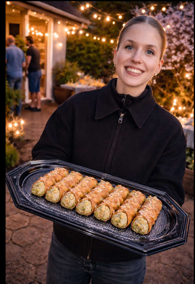
Beispiel für einen Fußzeilentext