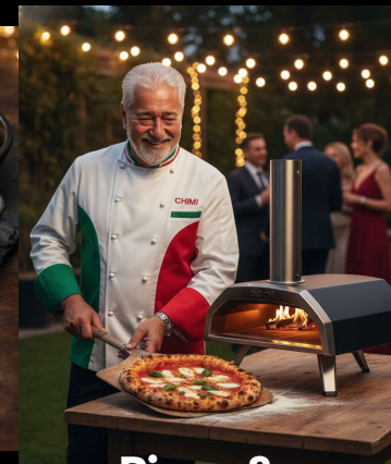
Pizza & Pastalavista